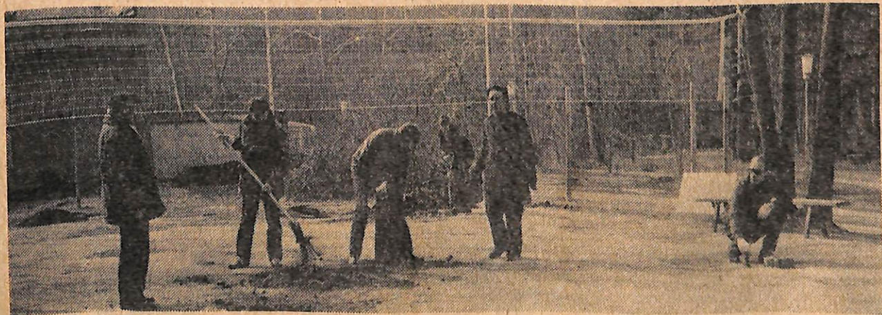
На снимке: идет коммунистический субботник